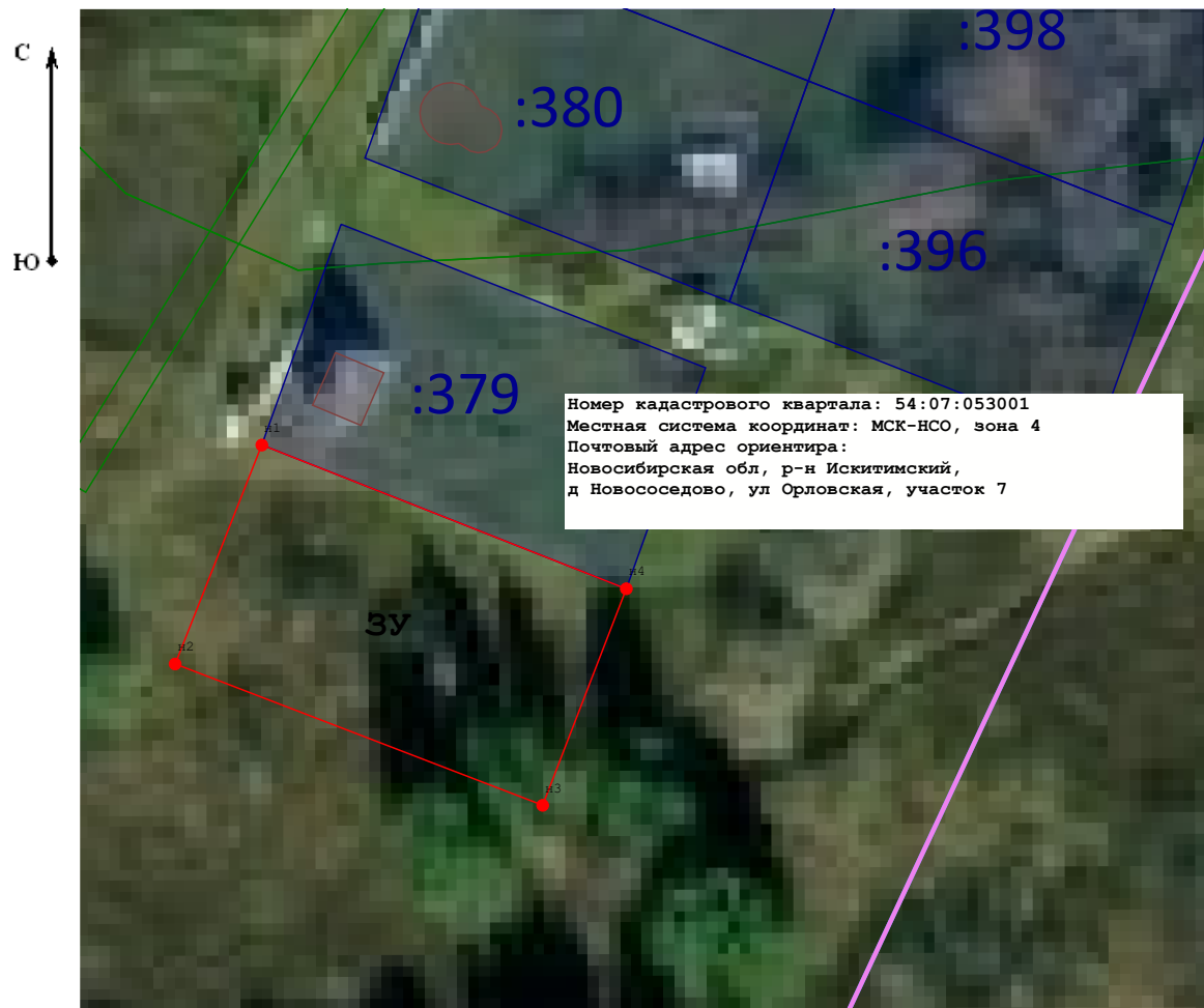
Масштаб 1:1 000